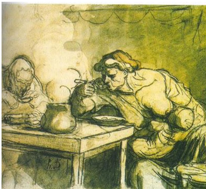
Familia obrera comiendo sopa. Dibujo de Daumier, 1853.